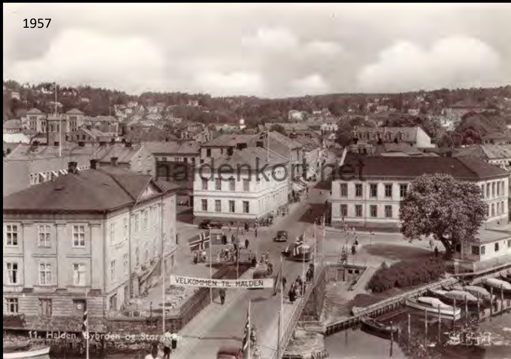
11. Halden, Bybroen og Storgården